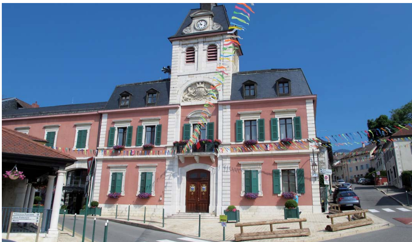
Hôtel de Ville, Gex (01)