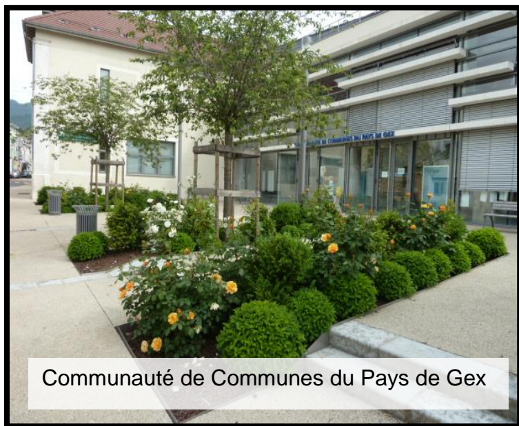
Communauté de Communes du Pays de Gex