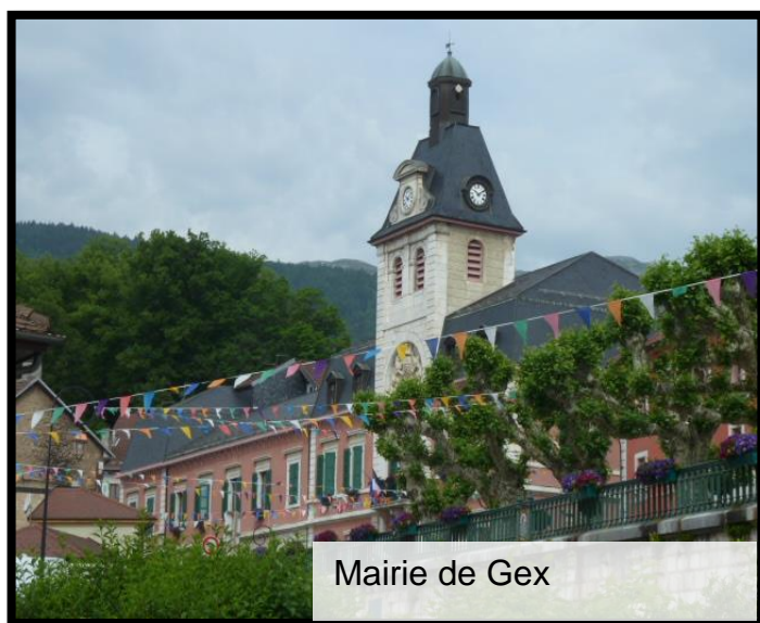
Mairie de Gex

Mairie de Gex 77 rue de l'horloge 01170 GEX 04 50 42 63 00 mairie@ville-gex.fr