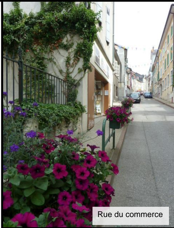
Rue du commerce