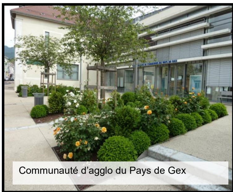
Communauté d'agglo du Pays de Gex