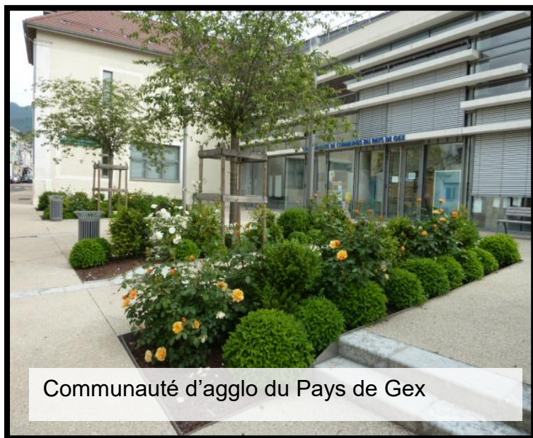
Communauté d'agglo du Pays de Gex