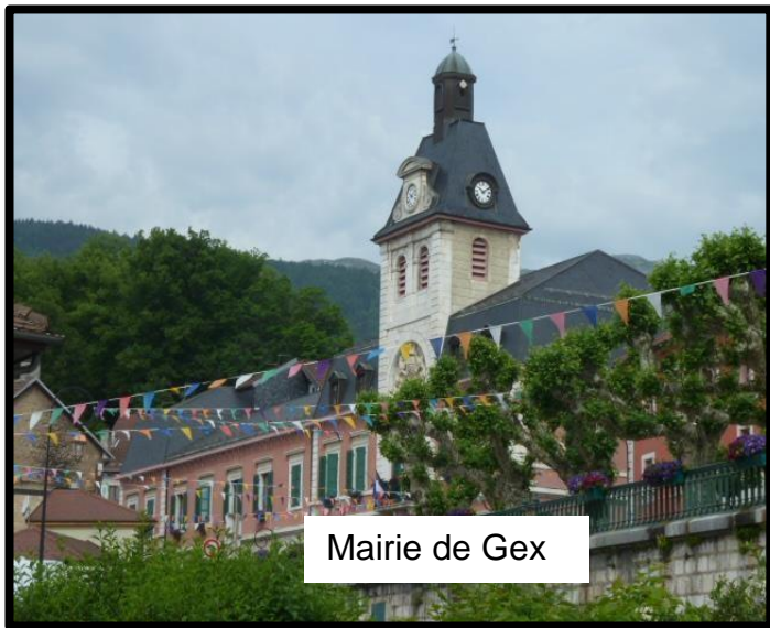
Mairie de Gex

Mairie de Gex 77 rue de l'horloge 01170 GEX 04 50 42 63 00 mairie@ville-gex.fr www.ville-gex.fr