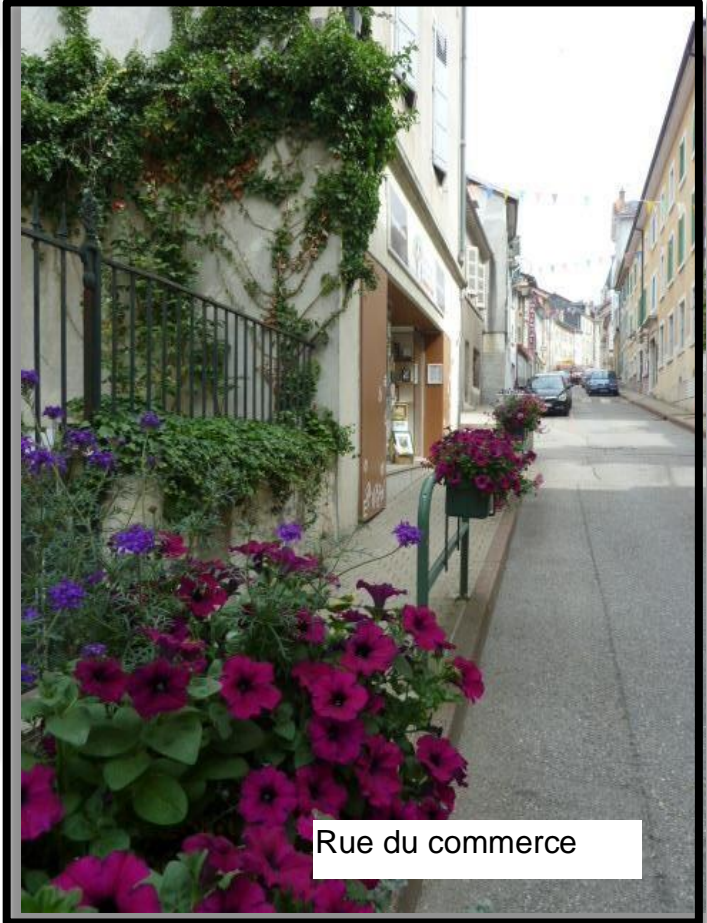
Rue du commerce