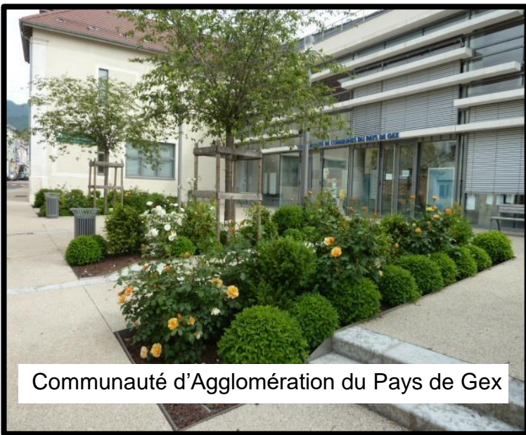
Communauté d'Agglomération du Pays de Gex