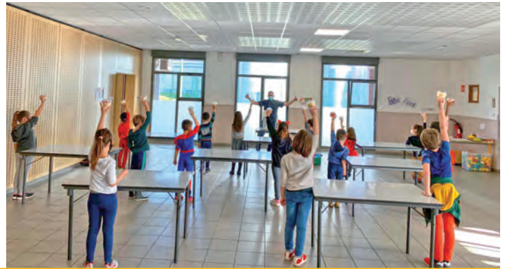
Du 8 au 19 février | Le Centre de loisirs « La Buissonnière » a proposé des activités et ateliers très appréciés sur le thème « la magie de l'hiver ».