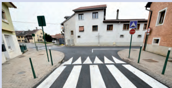
Aménagement d'un ralentisseur rue de Gex-la-Ville