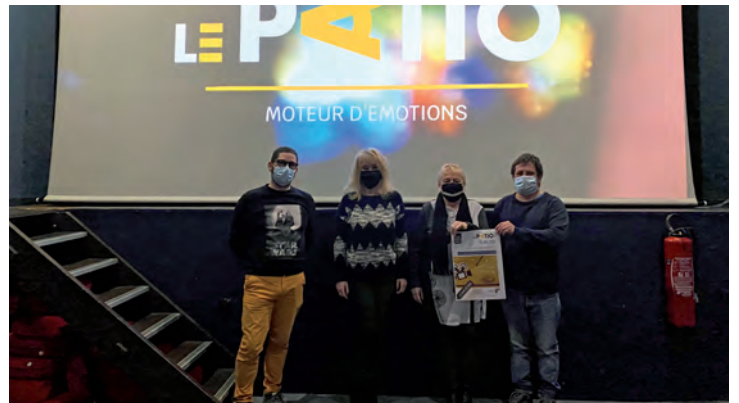
Jusqu'au 26 avril | Le concours 3 mots autour du cinéma pour 3 types de créations : court-métrage, nouvelle littéraire, affiche dessinée est toujours d'actualité.