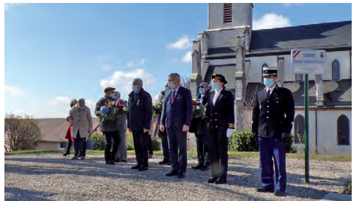
19 mars | Cérémonie en mémoire des victimes de la Guerre d'Algérie et des combats en Tunisie et au Maroc au monument aux Morts du square Colonel Arnaud Beltrame.