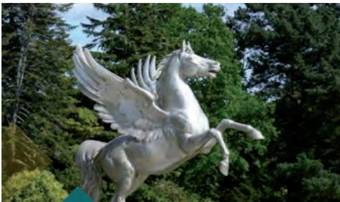
Du 13 au 29 mars | Le service culturel et la bibliothèque de Gex ont organisé un printemps des poètes sur le thème de l'édition 2021 : le désir. Les œuvres ont été publiées et exposées à la bibliothèque municipale.