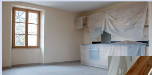
Finition en cours des 3 logements dans la ferme Crochat et la maison Benoit-Lison

Un bail commercial pour une durée de 9 ans a été signé en février dernier avec GRDF concernant des locaux réaménagés, pour un coût total de 82 430.23 €, 72 rue des Transporteurs en zone artisanale de l'Aiglette sud. La surface des locaux est de 123 m 2 de bureaux et de près de 188 m 2 de locaux techniques.