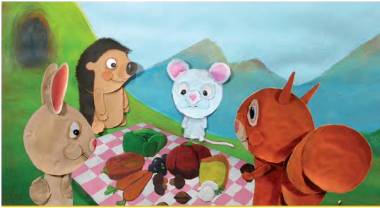
Depuis janvier | Le cinéma municipal « Le Patio » propose chaque semaine plusieurs courts-métrages « livrés à domicile » sur Cinéma Le Patio (cinegex.fr).