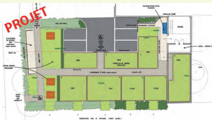
Exemple d'aménagement des différents jardins potagers sur la parcelle de La Ferme Crochat (livraison prévue avant l'automne 2021).

En conclusion, la Ville s'approprie peu à peu les objectifs qu'elle doit atteindre d'ici 2026. De nouveaux réflexes sont ainsi progressivement intégrés et des projets s'ajouteront à ceux existants sur tout le mandat municipal. Régulièrement, les avancées du dossier seront communiquées à la population.