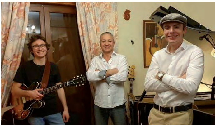
9, 11, 15, 17, 26 février, 3 et 12 mars | Le service culturel a mis en ligne sur la chaîne youtube de la ville des spectacles, contes, tours de magie, concerts de jazz.