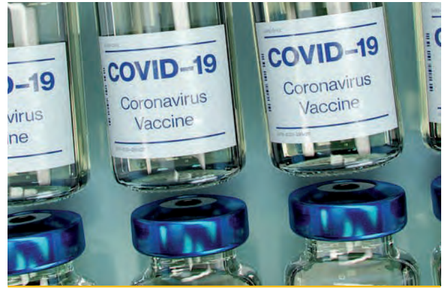
1 er février | Le centre hospitalier et la communauté d'agglomération du Pays de Gex obtiennent l'ouverture d'un centre de vaccination pour les publics prioritaires.