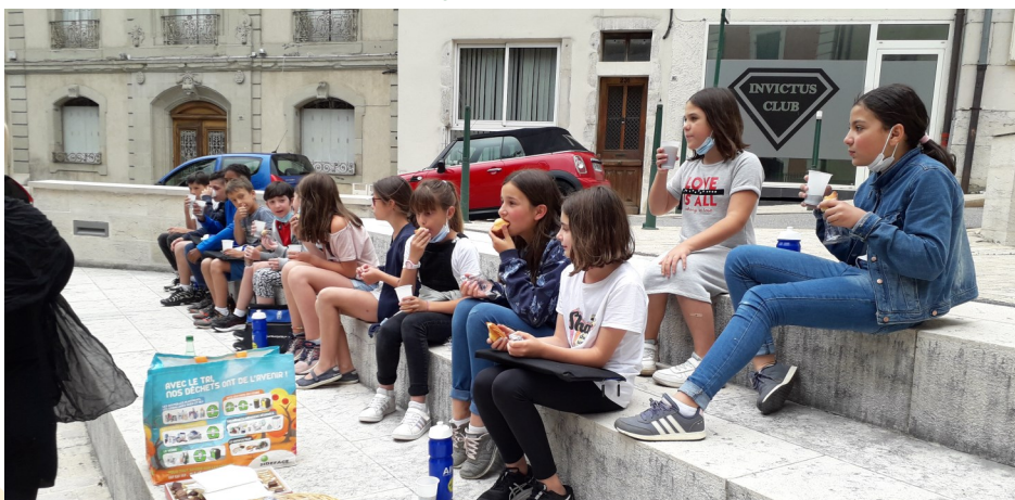
Petit goûter de fin de première année de mandat