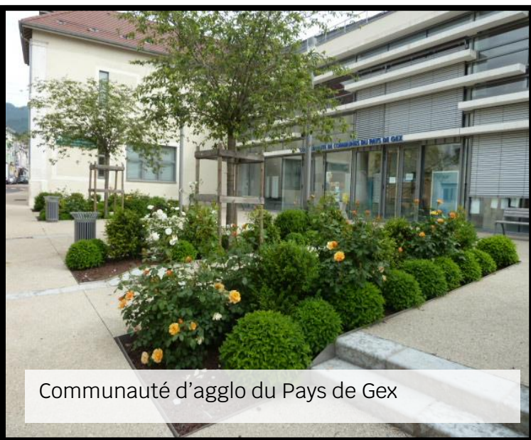
Communauté d'agglo du Pays de Gex