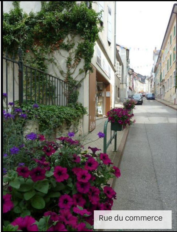
Rue du commerce