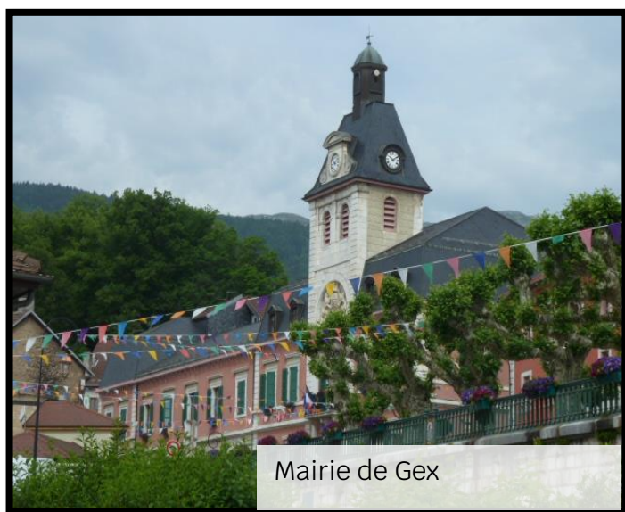
Mairie de Gex