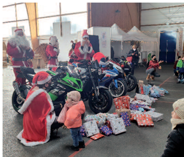
12 décembre | De sympathiques Pères-Noël motards ont joyeusement animé le quartier Perdtemps où se déroulait le Festival Tôt ou T'Arts du CSC Les Libellules.