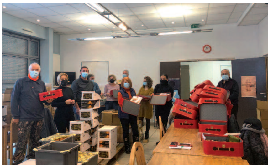
11 décembre | Confection puis distribution par le Centre Communal d'Action Sociale et les élus de 318 colis destinés aux Aînés.