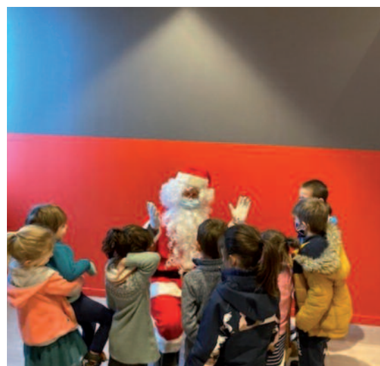
15 décembre | Visite inattendue du Père Noël après le spectacle « Rendez-vous contes de Noël » qu'organisait la MJC à la salle des fêtes.