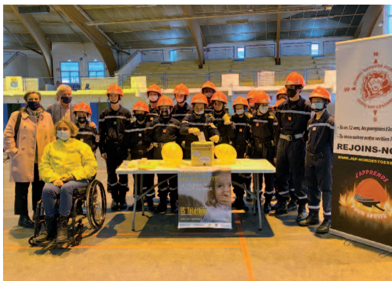
4 décembre | L'action AFM-Téléthon a permis de reverser 788 € (10 € de plus qu'en 2019) grâce aux animations + 350 € pour celle du Club Alpin Français (mur d'escalade) + 800 € de la ville.