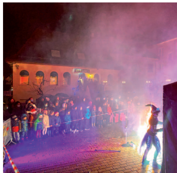
Du 1 er au 17 décembre | « Gex fête Noël ! » sous la pluie pour l'ouverture des festivités le 1 er décembre mais avec le public au rendez-vous !