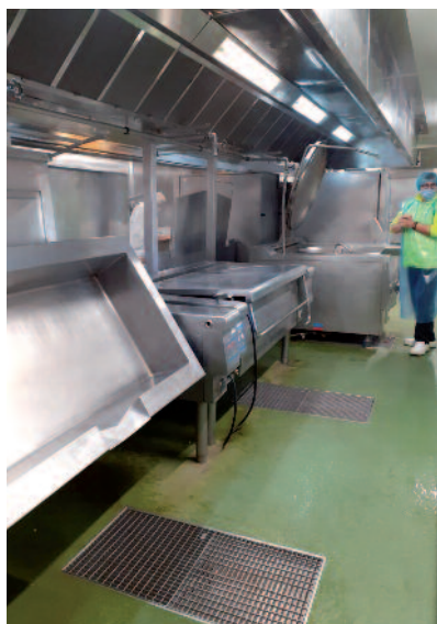
24 novembre | Visite des élus et responsables « Actions éducatives et scolaires » et « Solidarités » dans les cuisines de RPC, la restauration pour collectivités, à Manziat (Ain).