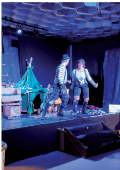
1 er décembre | « Au chaud pour Noël », le 5 e spectacle de la saison culturelle a réuni un public familial de 80 personnes.