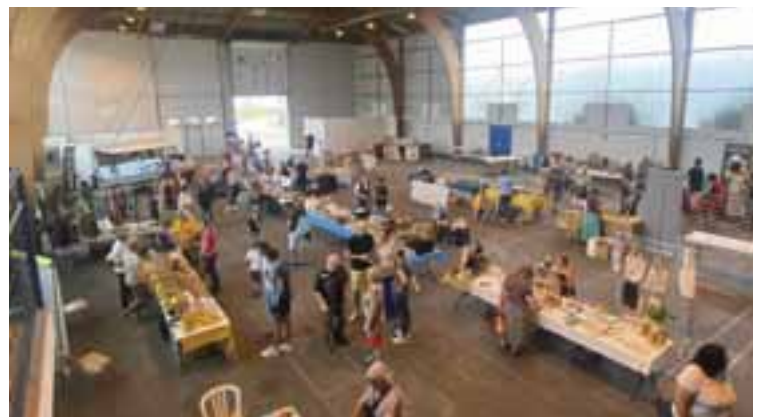
27 août | La deuxième édition d'Estiv'aGex proposait des circuits d'animations au centre-ville, un marché nocturne et des animations à l'espace Perdtemps.