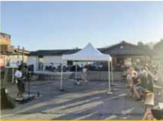
21 juillet | Animation musicale estivale avec Journeyman à l'Aiglette sud.