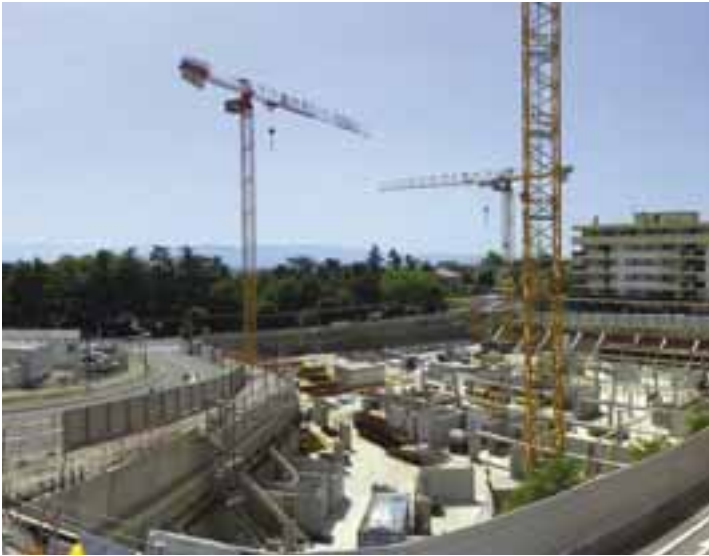
27 juin 2022 Reprise du chantier

Vous le remarquerez sûrement en comparant les deux photographies ci-dessous prises à deux mois d'écart !