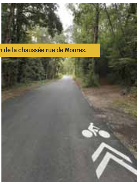
La réfection de la chaussée rue de Mourex.