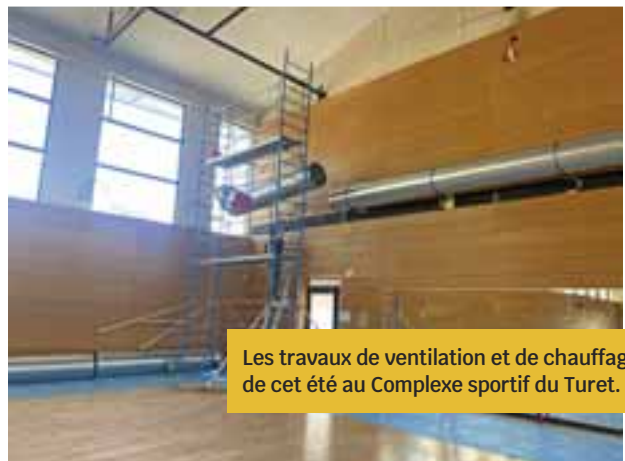
Les travaux de ventilation et de chauffage de cet été au Complexe sportif du Turet.