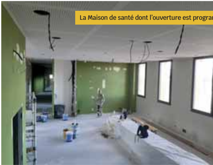
La Maison de santé dont l'ouverture est programmée pour début 2023.

La période estivale aura permis de réaliser ou d'avancer les principaux chantiers communaux en bâtiments, voiries + déplacements doux et en aménagements urbains dont voici une présentation non exhaustive.