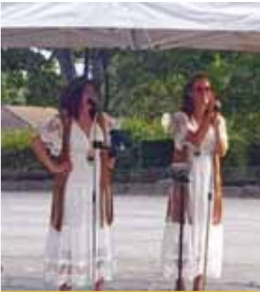
5 août | Animation musicale estivale avec le duo Sweeties au camping municipal Les Genêts.