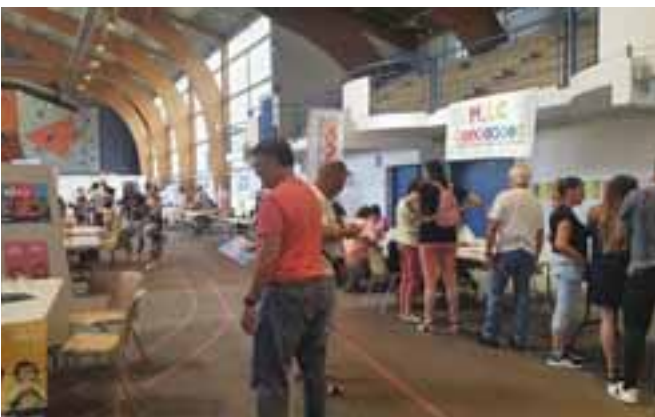
27 août | Une belle édition du forum des associations à l'espace Perdtemps.