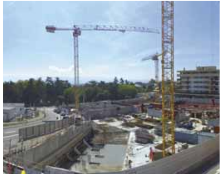
29 août 2022