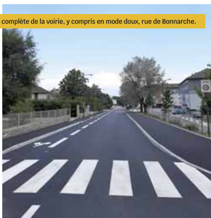
La réfection complète de la voirie, y compris en mode doux, rue de Bonnarche.