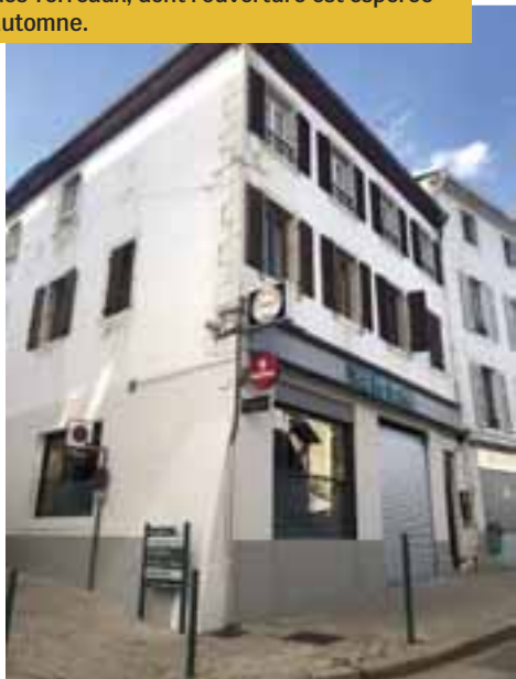
Le ravalement de la façade et les aménagements intérieurs de mise aux normes du Bar Le Trèfle, rue des Terreaux, dont l'ouverture est espérée cet automne.