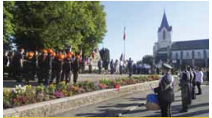
13 juillet | Commémoration de la prise de la Bastille en 1789 et de la fête de la fédération en 1790.