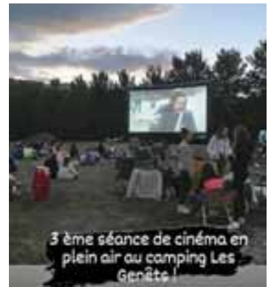
22 août | Séance de cinéma en plein air avec « Kaamelott » au camping municipal Les Genêts.