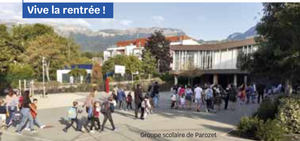
Groupe scolaire de Parozet

La rentrée du jeudi 1 er septembre dernier s'est bien déroulée pour l'ensemble des élèves gexois. Le nombre de classes est stable. Bonne année scolaire à tous : directeurs et chefs d'établissement, enseignants, élèves et agents des écoles maternelles et élémentaires publiques et privées, des collèges Charpak et Jeanne d'Arc et du Lycée Jeanne d'Arc !