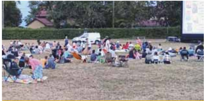
25 juillet | Séance de cinéma en plein air avec « Les Croods 2 » au camping municipal Les Genêts.