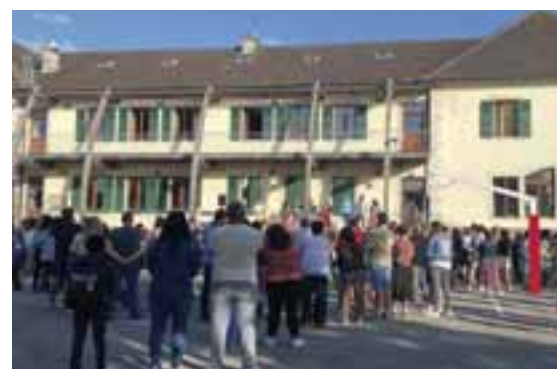
Groupe scolaire de Perdtemps