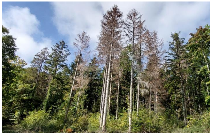
Groupe d'épicéas atteints par le scolyte et en train de mourir

Dans tous les cas, l'objectif sera de garantir la pérennité de l'état boisé et de permettre aux générations futures de gessiens de continuer à bénéficier des services que leur rend leur forêt communale.